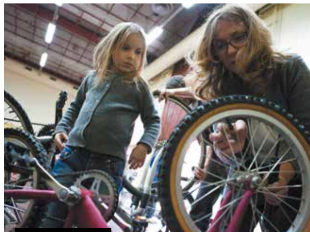
Atelier réparation de vélo avec la Cyclofficine.

Avis aux participants qui viendront avec leurs factures d'eau et d'électricité ! Les vingt premiers se verront attribuer un kit économie d'énergie. Un super pack énergie composé, entre autres, d'un régulateur de douche, d'aimants écogestes, d'une douche minute sablier, d'un thermomètre 3 en 1 et de plein d'ampoules led. Les kits seront installés directement à domicile par les jeunes volontaires de Mediaterrre/Intergénéreux.