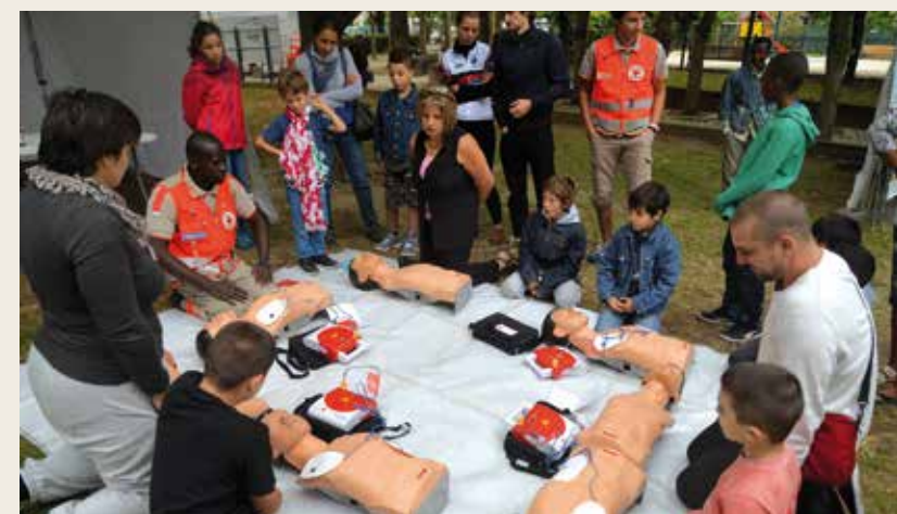
Initiation au massage cardiaque au stand de La Croix Rouge, édition 2015.

10 septembre De 10.00 à 18.00 Place de la Pointe et quai de l'Aisne, du Mail Charles de Gaulle à la rue Lakanal Renseignements au ☎ 01 49 15 41 83