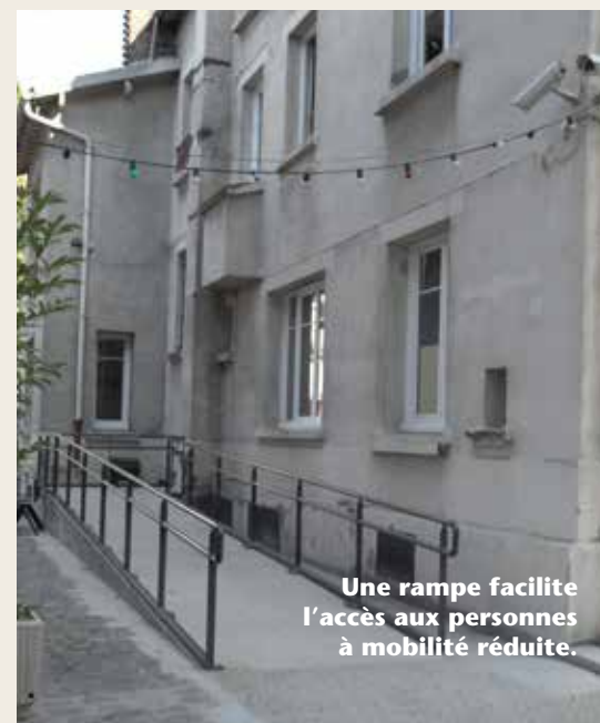
Une rampe facilite l'accès aux personnes à mobilité réduite.

ce sens : il est utilisé, par exemple, par l'association Handijoy deux jours par semaine. L'escalier d'origine, tout en bois, mène, à gauche, à l'espace de travail partagé, un espace ouvert sans ré-