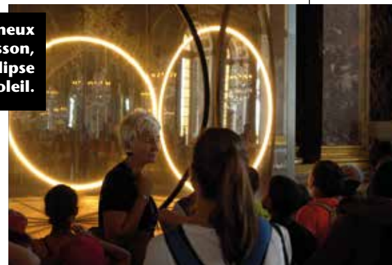
Cercles lumineux par Olafur Eliasson, évoquant l'éclipse du soleil.