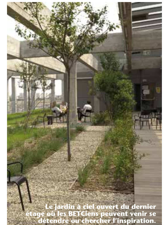
Le jardin à ciel ouvert du dernier étage où les BETCiens peuvent venir se détendre ou chercher l'inspiration.

Au cœur des anciens Magasins généraux, un immense espace ouvert où des passerelles permettent de passer d'un bâtiment à l'autre.