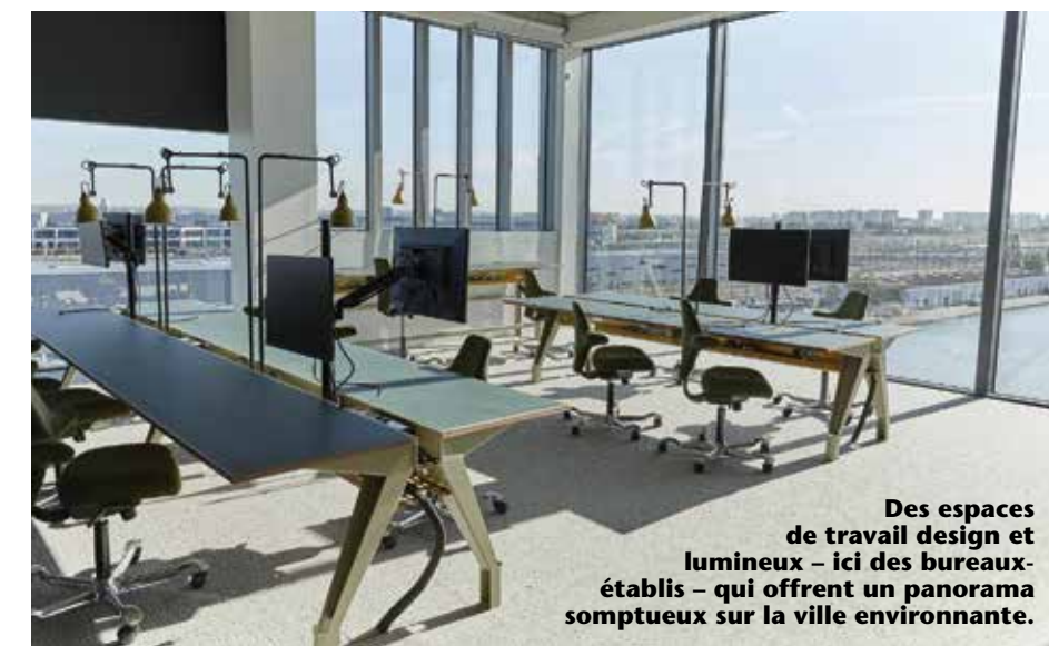
Des espaces de travail design et lumineux – ici des bureaux-établis – qui offrent un panorama somptueux sur la ville environnante.