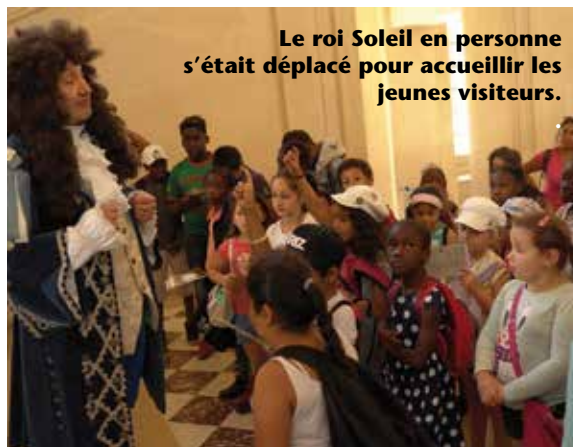
Le roi Soleil en personne s'était déplacé pour accueillir les jeunes visiteurs.

À 13 heures, sonne l'heure du pique-nique organisé sous les hauts