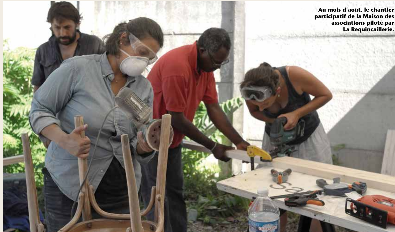
Au mois d'août, le chantier participatif de la Maison des associations piloté par La Requincaillerie.

observation. Un lieu qui a fait l'objet fin août d'un chantier participatif piloté par La Requincaillerie, passée maître dans le réemploi et la récup'. Un espace « salon » composé d'une table basse et d'un canapé – idéal pour les réunions informelles ! – côtoie quatre postes informatiques et une petite bibliothèque spécialisée.